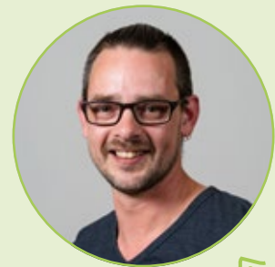
Thiemen Visser Voorman Jorritsma Bouw