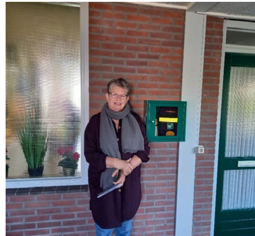
Aan de gevel aan de Walfridushof in Bedum is bij een bewoner een AED geplaatst.

In Bedum is laatst een AED-apparaat geplaatst. Dat is een draagbaar apparaat dat het hartritme kan herstellen als iemand een hartaanval krijgt. Twee bewoners hebben een cursus gevolgd, zodat zij eerste hulp kunnen bieden met de AED.