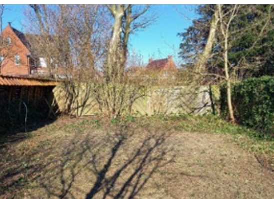
De tuin aan de Ludgersstraat voor en na de aanpak samen met Stichting Present