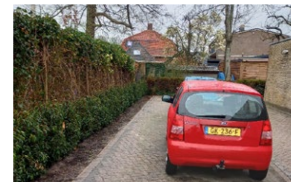
Langs de parkeerplaats van de Foelkiusflat is de oude heg weggehaald en vervangen door een nieuwe. Dat voorkomt ook schade aan auto's.

Dus weet dat je er nooit alleen voor staat in de buurt. Er zijn genoeg mensen en organisaties om je te helpen!