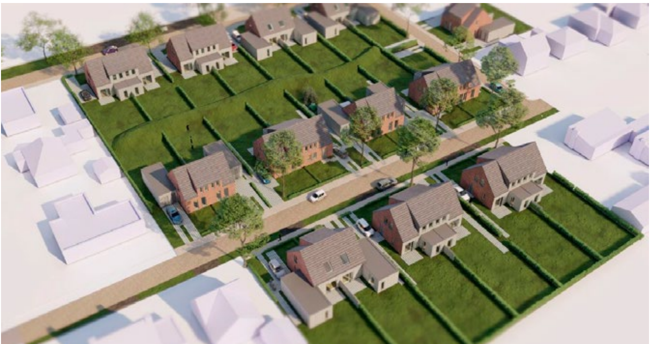
Dit is het voorlopig ontwerp

De aanwezige bewoners reageerden enthousiast op de plannen voor hun nieuwe woningen. De aankomende periode wordt het ontwerp verder uitgewerkt. Vervolgens wordt in overleg met de bewoners een keuze gemaakt welke aannemer de nieuwe woningen gaat bouwen. Zodra bekend is wanneer de tijdelijke huisvesting voor fase 3 beschikbaar is, kunnen wij aangeven wanneer de bouw van deze nieuwe woningen kan starten.