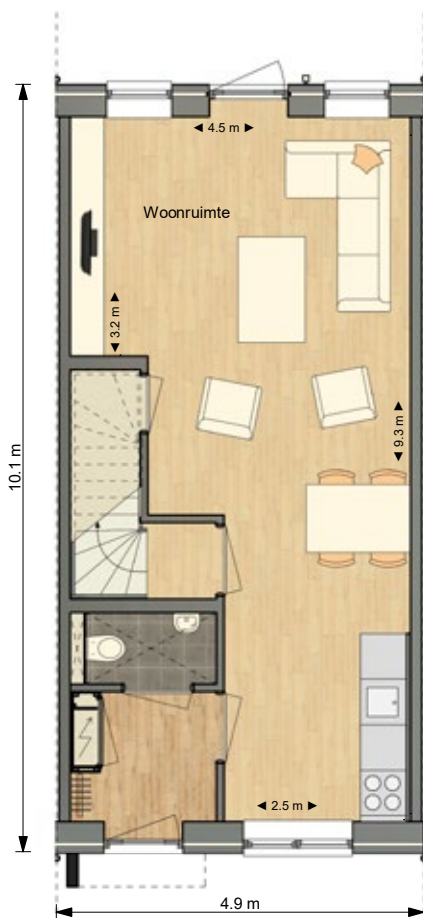
Plattegrond begane grond

De woningen worden gasloos gebouwd. Ze zijn voorzien van luchtverwarming en een warmtepomp. Achter de woningen komt een fietsenberging van ca. 6 m 2 . Tegenover de woningen worden door de gemeente parkeerplaatsen aangelegd.