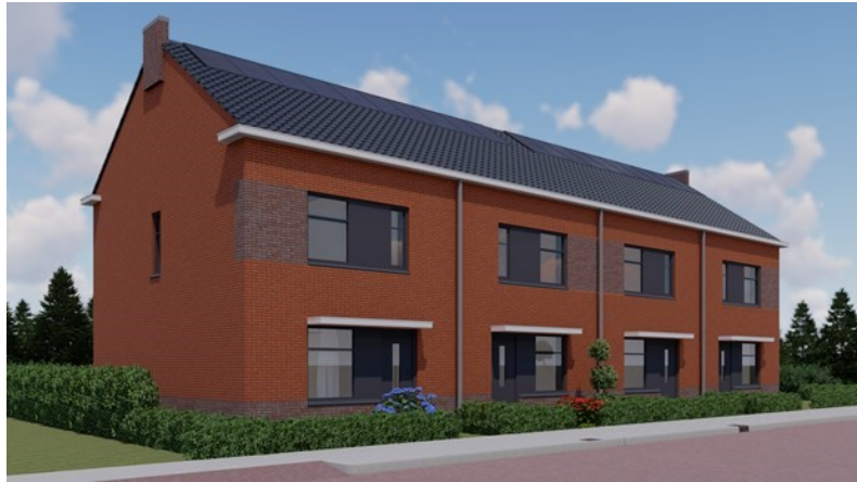
Impressie nieuwbouw Standwerker

Vanaf 6 mei start een periode van 6 weken waarin omwonenden/belanghebbenden nog een laatste keer een reactie mogen geven als zij bezwaar hebben tegen de bouw. Dit heet een voorlopige voorziening.